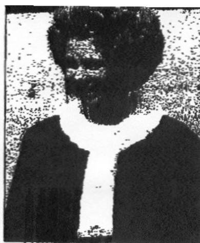
Η βασίλισσα Φρειδερίκη.

Ακριβώς αυτό με ενόχλησε, ότι η εικόνα που είχαν δεν ήταν πραγματική. Βέβαια η Ελλάδα δεν ήταν ΗΠΑ αλλά εν πάση περιπτώσει δεν ήταν και η ζούγκλα της Αφρικής όπως υποτίθεται με τις ερωτήσεις τους. Έγραψα σε πολλούς ανθρώπους τότε, στη διετία 1953-1954, να μου δώσουν στοιχεία πώς είχε διαμορφωθεί η οικονομία της Ελλάδος, πόσον είχε υποφέρει η Ελλάς στον πόλεμο, και μετά στον συμμοριτοπόλεμο, και πώς άλλαξε και τι προσπάθειες έκαμε για να βελτιωθεί το επίπεδο του ελληνικού λαού. Ήταν ένα από τα πάρεργά μου αυτά, γιατί ο κύριος σκοπός μου εδώ, στο MIT, ήταν να πάρω το διδακτορικό μου δίπλωμα και εν πάση περιπτώσει να κάνω κάποια έρευνα. Το διδακτορικό μου το έκαμα με τον Van der Graaf και τον Trump σε εταχυντές με εφαρμογές στον καρκίνο. Δεν θα σου πω τι σκέψεις μου γέννησαν οι σπουδές μου για τη συμβολή που θα μπορούσα να κάνω σαν επιστήμων στον τομέα αυτόν, γιατί μετά από ένα δυο χρόνια άρχισα να επιδιώκω και αυτό. Άλλη ώρα θα το συζητήσουμε. Θα συνεχίσω στον ειρμό των εναιουμάτων των σχετικών με την