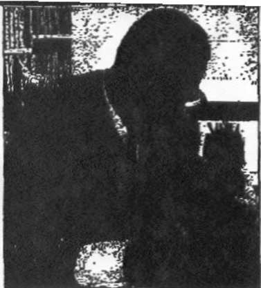
Ο Κωνσταντίνος Α. Δοξιάδης.

αυτές ήταν για διεθνή θέματα, τι συμβαίνει σε διάφορες χώρες.